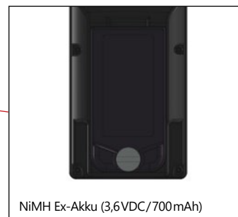
NiMH Ex-Akku (3,6VDC/700mAh)